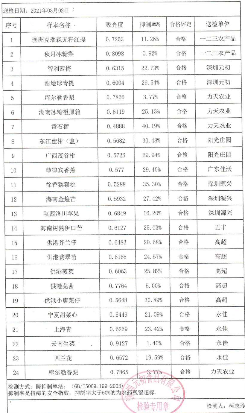
深圳元初水果蔬菜农药残留测量数据表